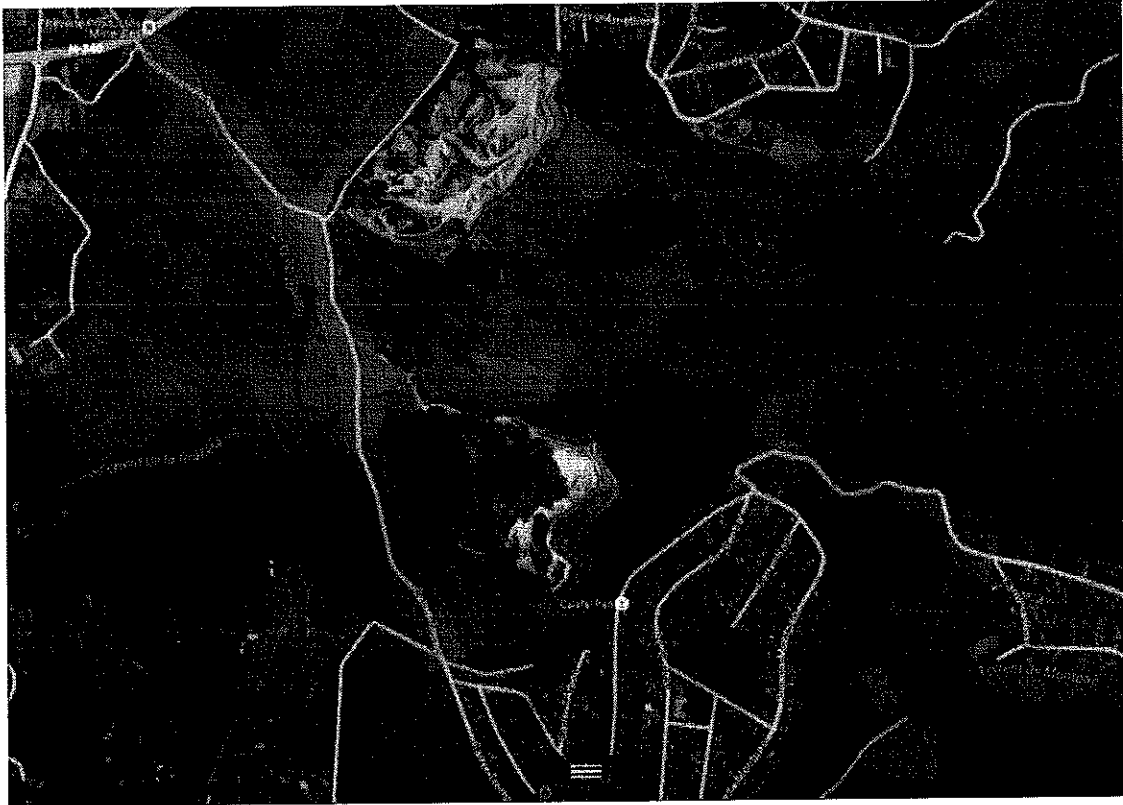
Imagen situación de Cami de Montmar entre urbanizaciones y conexión desde Calafell Parc con N340.

3º.- Que por este motivo los vecinos de esta zona se sienten agraviados comparativamente con otras zonas del municipio.